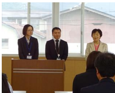
所長(右)と相談支援専門員の計3名が対応いたします