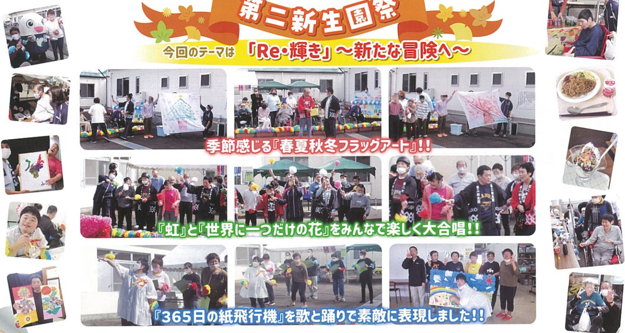
季節を感じる『春夏秋冬フラッグアート』!!