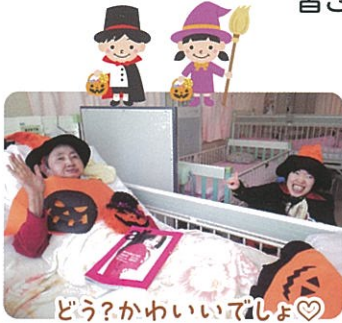
どうかかわいいでしょ♡

秋といえばハロウィーン♪ 利用者の皆さん、可愛らしく仮装しましたよ。そして食欲の秋!個別外出ではドライブスルーでマクドナルドを堪能しました。通所棟“ぽかぽか”では「お月見会♪」餅つきをしてお団子づくり、お月見会の雰囲気を楽しみました。皆さん、とっても素敵な表情を見せてくれました(^^)