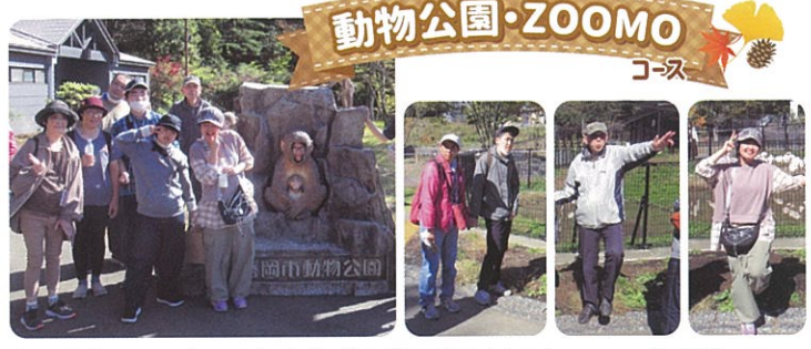
動物公園・ZOOMO コース

花巻空港と童話村コース。当日は一日中雨の予報でしたが、皆さんの願いが通じたようで要所要所は晴れ、楽しく過ごされました。