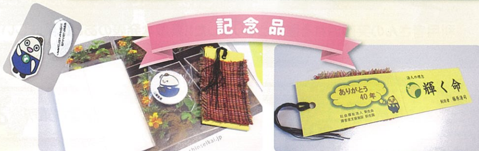
500セット用意した来場記念品がすべてなくなりました! (マグネット、しおり、ポケットティッシュ)