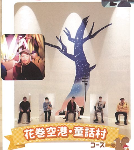
花巻空港・童話村 コース

花巻空港と童話村コース。当日は一日中雨の予報でしたが、皆さんの願いが通じたようで要所要所は晴れ、楽しく過ごされました。