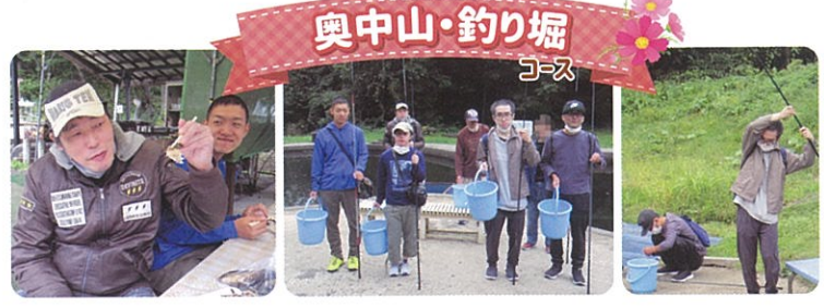
奥中山・釣り堀 コース

今年度、改装オープンした動物公園「ZOOMO」コース。秋晴れの中で穏やかに過ごす動物に癒され、歩いた後は皆で美味しい食事となりました。