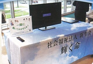
本部コーナーで法人紹介ビデオを放映しました