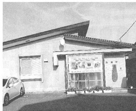
長い間お世話になり、思い出がいっぱいの現在の建物です

今後始まる建設工事に伴い、利用者さんの安全を最重点項目として取り組みながら、利用者さんに喜んでいただけて、地域の方が気軽に利用していただけるような、そんな施設が完成することを心待ちにしております。