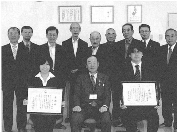
役員の方々と記念撮影