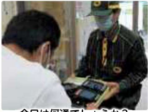
今日は何通でしょうか？