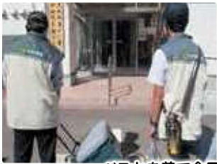
ベストを着て今日も元気に出発～!!