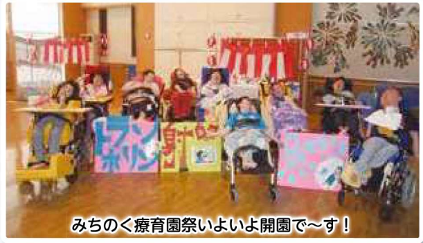
みちのく療育園祭いよいよ開園で～す!