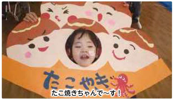
たこ焼きちゃんです!