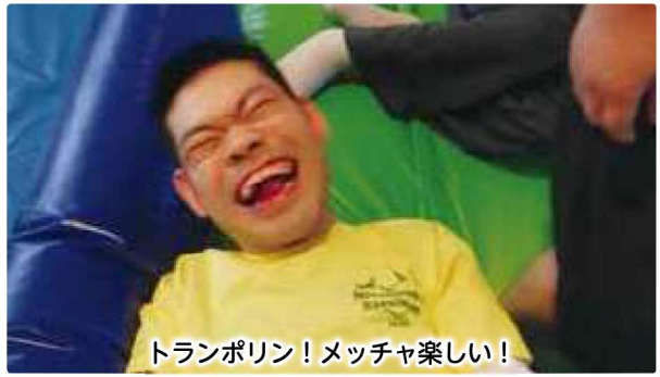
トランポリン! メッチャ楽しい!