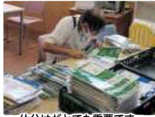
仕分けがとても重要です。