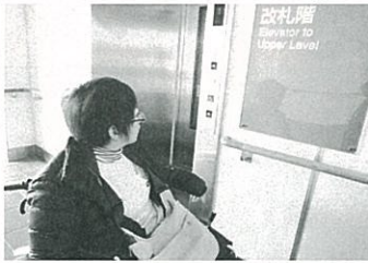
公共交通機関訓練

就労移行支援では4月から1月現在までに3名の方が就職されました。 就職先は資格を活かし医療関係に、器用さを活かして飲食店へ、今までの 経験を活かしクリーニング関係にと就職しております。 慣れない環境での悩みもあるようですが、 企業の皆様に支えられ頑張っています。