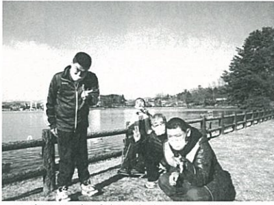
五郎沼で岩手山と白鳥をバックに…。