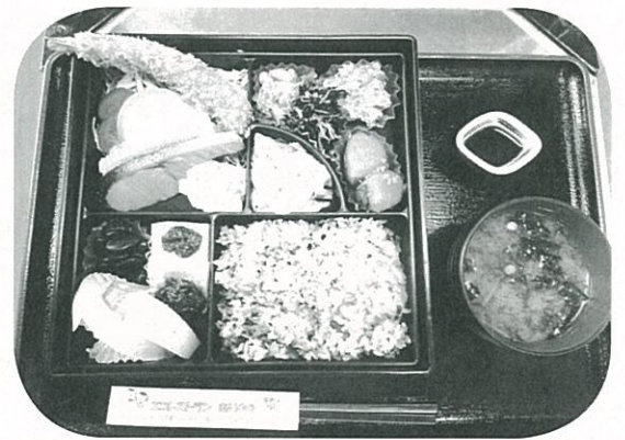
あいのの特製 お弁当