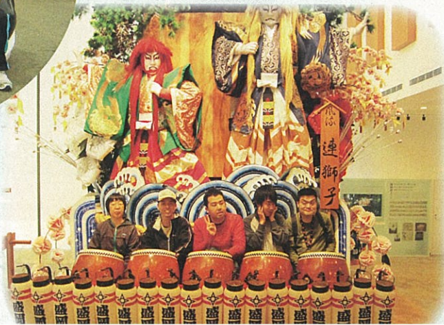
もりおか歴史文化館