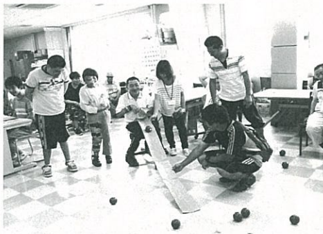
ニチレクボール 狙いを定めて高得点

ワークセンターむろおかでは、今年度から矢巾町体育協会の指導員の方をお呼びして、2カ月に1回健康運動活動を実施しています。ノルディックウォーキング、スカットボール、ニチレク、輪投げ、カローリングなど楽しく行っています。運動不足も解消し、気分もリフレッシュしています。