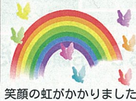
笑顔の虹がかかりました