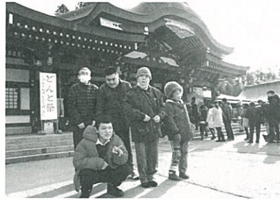
八幡宮で…「今年もいい事ありますように…」