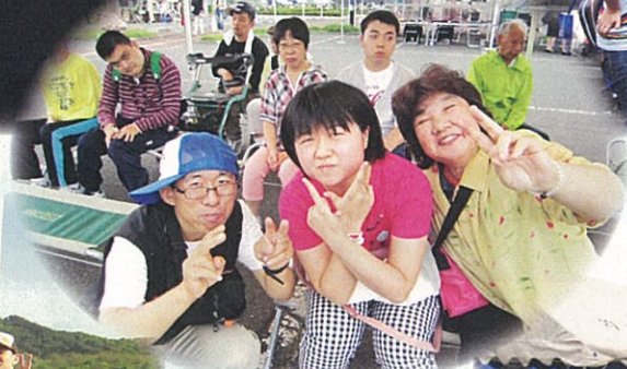
矢巾町ふれあい広場