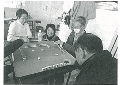
マージャン対戦中 皆さん真剣です。