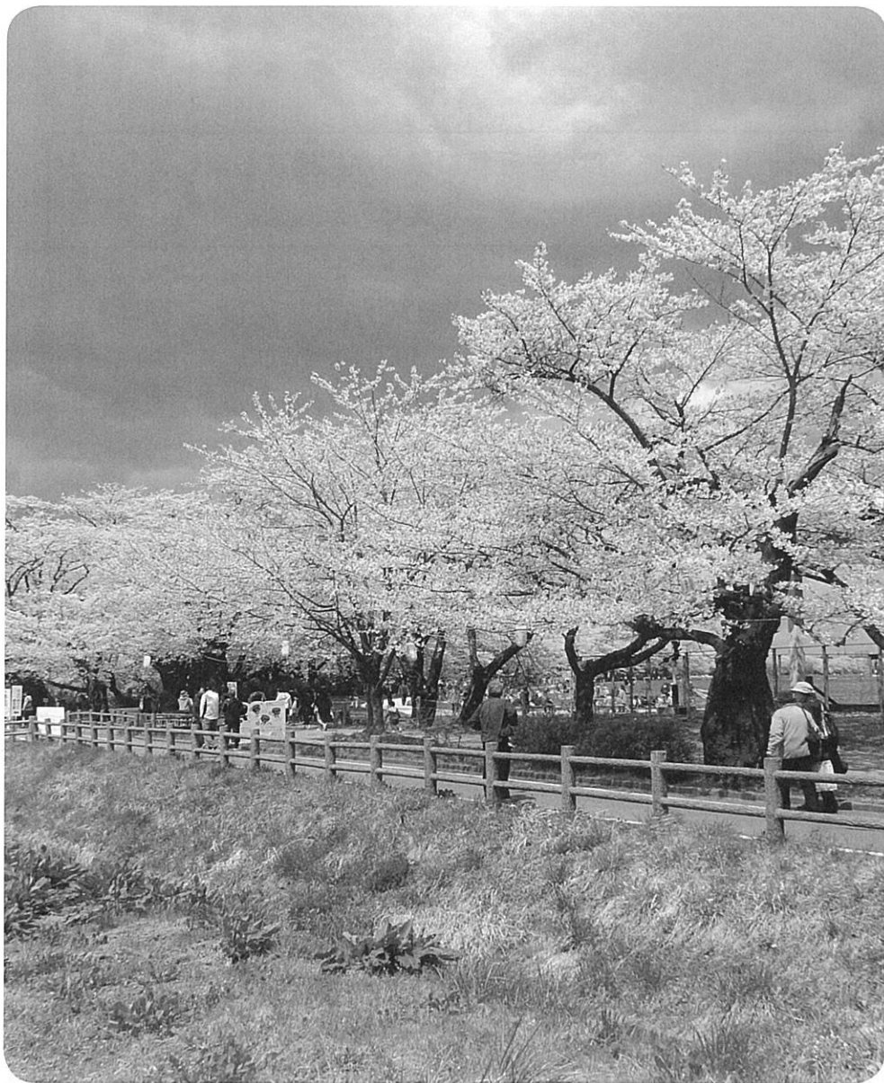
東北有数の桜の名所として知られている北上展勝地。「さくらの名所 100 選」「みちのく三大桜名所」にも選ばれており、お花見外出にて可憐な桜並木を堪能してきました。