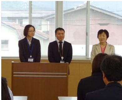
所長(右)と相談支援専門員の計3名が対応いたします